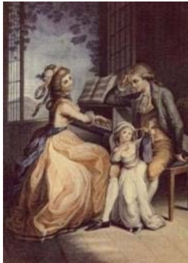
"Lotte y Werther", cuadro inspirado e Las desventuras del joven Werther Goethe-Museum de Dusseldorf.

Werther cultiva una amistad íntima con Charlotte y Albert a pesar de la pena que esta relación le produce, pena que finalmente le lleva a abandonar Walheim para dirigirse a Weimar.