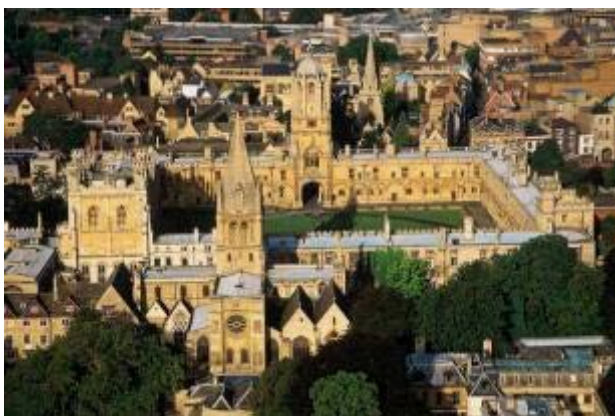
Universidad de Oxford

La crónica periodística transmitió la noticia de una joven estudiante, adolescente de 21 años, de la Universidad de Oxford que se había suicidado porque no soportaba más la tensión previa a los exámenes, presa de la angustia que le provocaba la posibilidad de no aprobarlos. En la escuela en que cursó sus estudios secundarios había sido una de las mejores de su clase. Representó a Escocia en varios certámenes de cultura general.