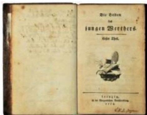
Portada de la primera edición.

Fue una novela muy popular entre los jóvenes de la época, muchos de ellos llegaron incluso a suicidarse de formas que parecían imitar la del protagonista. Las autoridades de Italia, Alemania y Dinamarca llegaron a prohibir la novela.