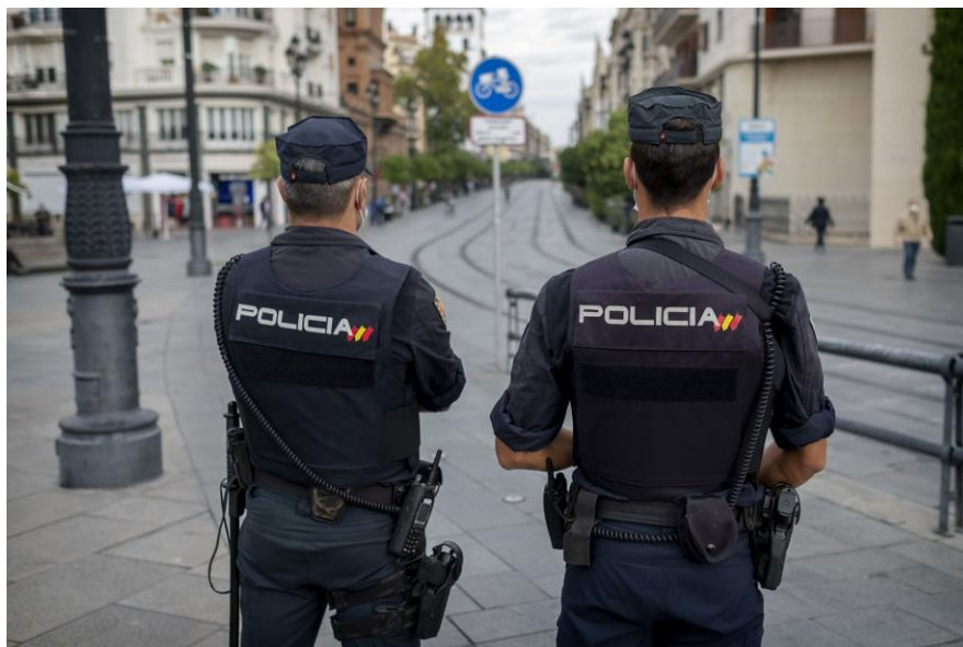
Agentes de Policía Nacional en el centro de Sevilla, durante labores rutinarias de vigilancia.

El documento incide en la atención psicológica a los agentes que actúan en catástrofes, han tenido que usar su arma o han resultado gravemente heridos