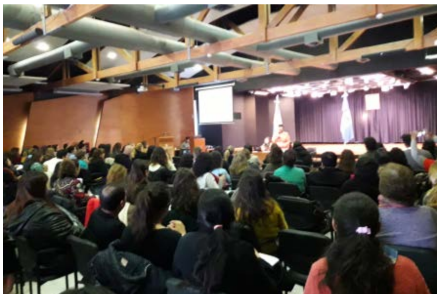
Participantes en el Taller de Sensibilización en la Prevención del Suicidio organizado por la Dirección Provincial de la Juventud en el Auditorio de la Casa de Gobierno