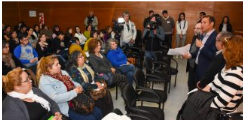
Animado intercambio en el Taller con la participación activa de Técnicos, Docentes y Autoridades